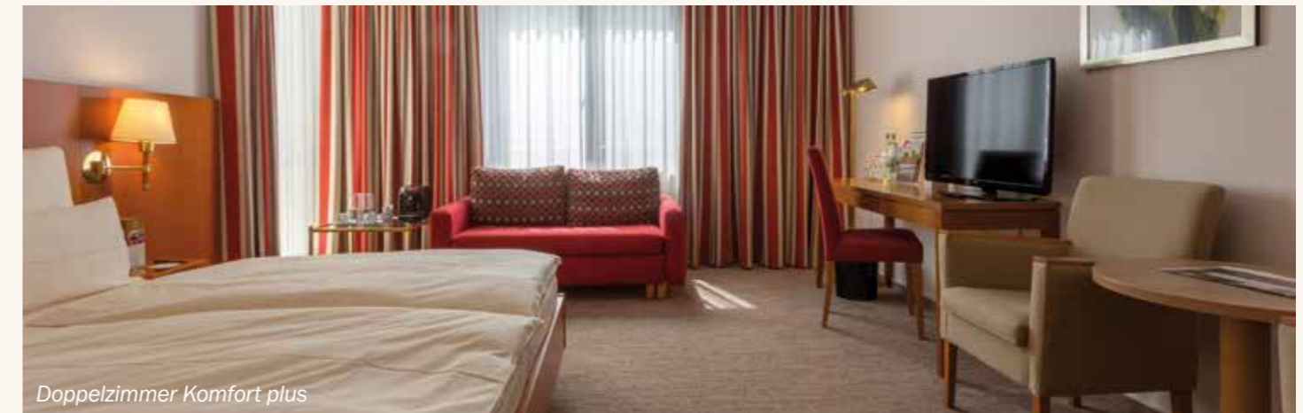
Doppelzimmer Komfort plus