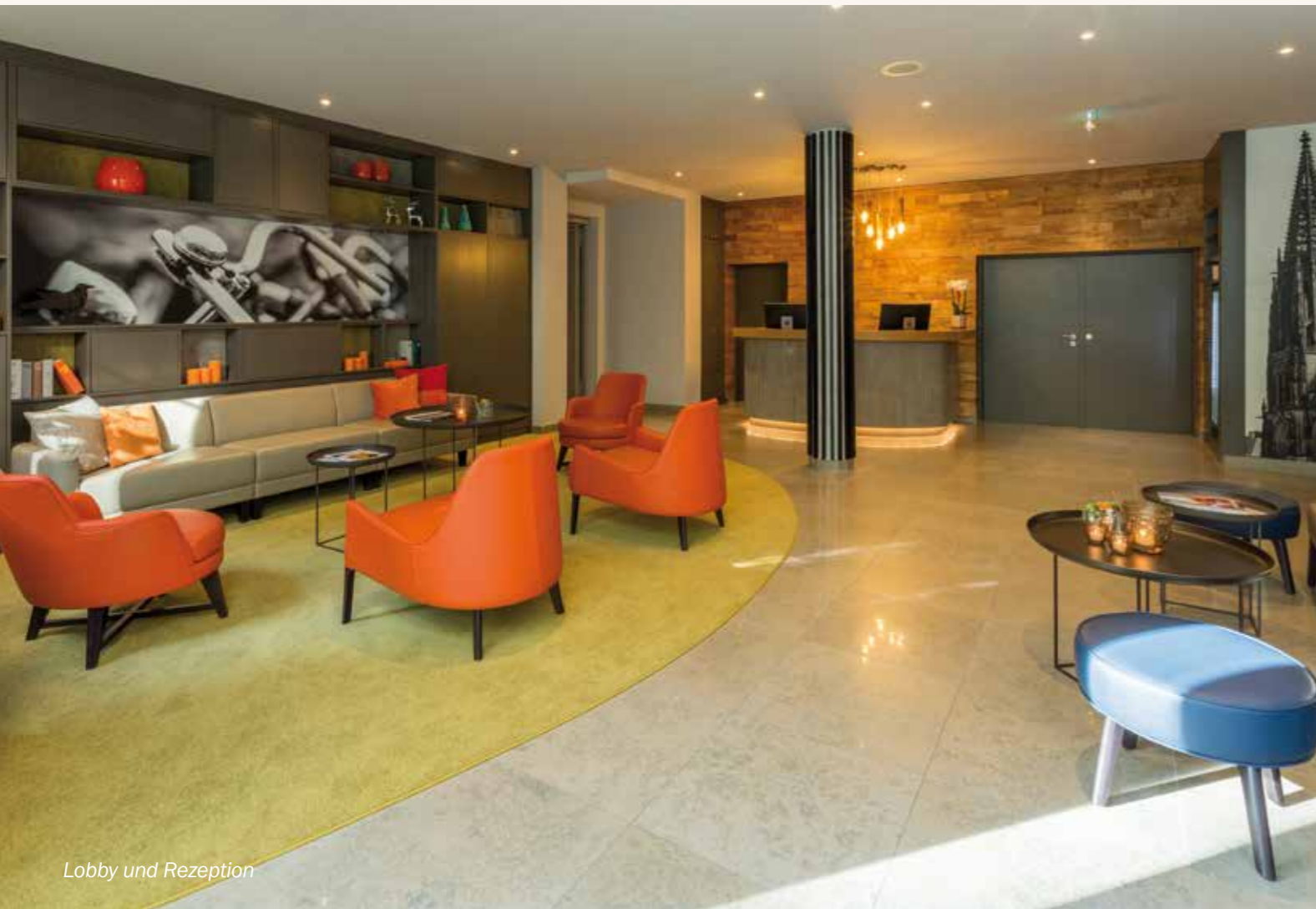
Lobby und Rezeption