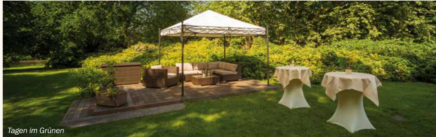
Tagen im Grünen

Alle Räume sind mit Veranstaltungstechnik ausgestattet. Bei schönem Wetter bietet sich die weitläufige Parklandschaft, die sich direkt an das Tagungs-Center anschließt, auch für Gruppenarbeiten an.