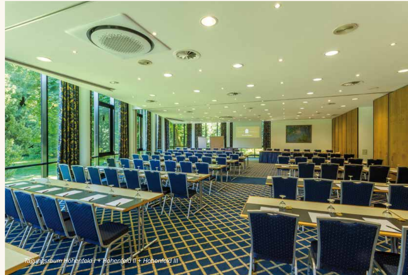
Tagungsraum Hohenfeld I + Hohenfeld II + Hohenfeld III