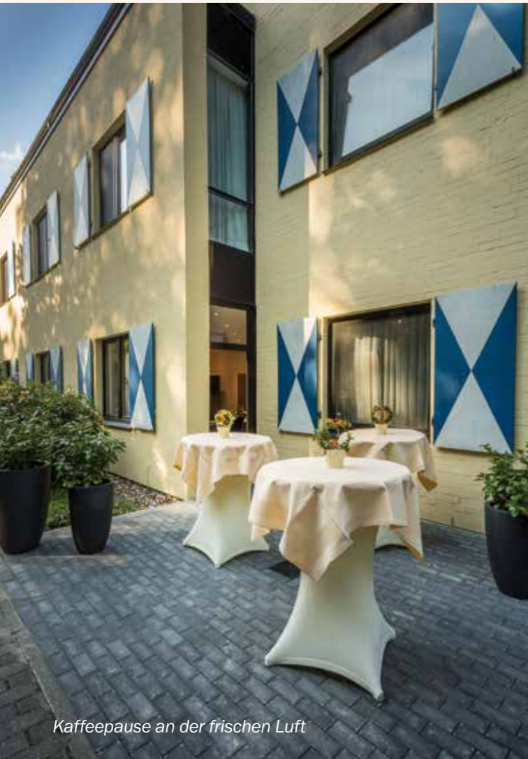
Kaffeepause an der frischen Luft

Tagungsraum Pferdestall – 17-50 Personen