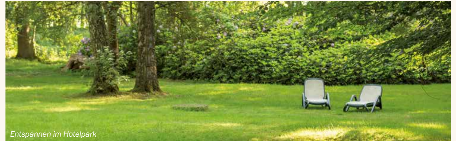
Entspannen im Hotelpark

Wer lieber das gemütliche Zusammensein und den Austausch mit Kollegen bevorzugt, wird unsere gemütliche Bierstube „Börneken“ lieben. Hier servieren wir deftige regionale Spezialitäten in uriger Atmosphäre. In der warmen Jahreszeit empfehlen wir unsere Terrassen – im Winter sorgt ein prasselndes Kaminfeuer für gemütliche Stimmung.