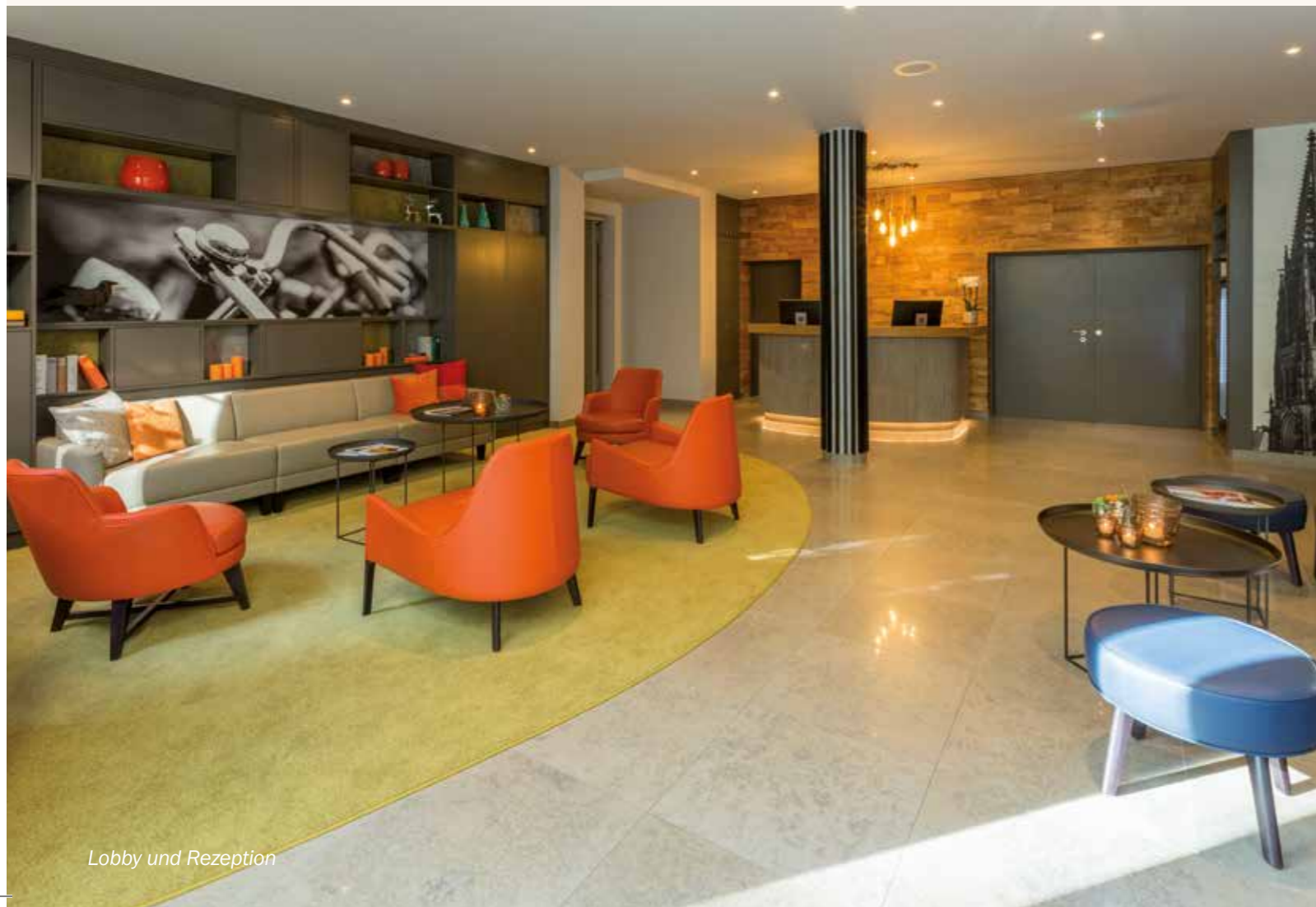
Lobby und Rezeption