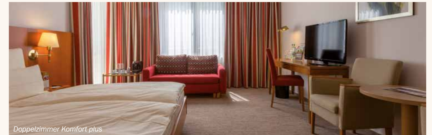
Doppelzimmer Komfort plus